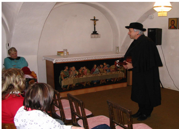
Akce Hašlerovy písničky