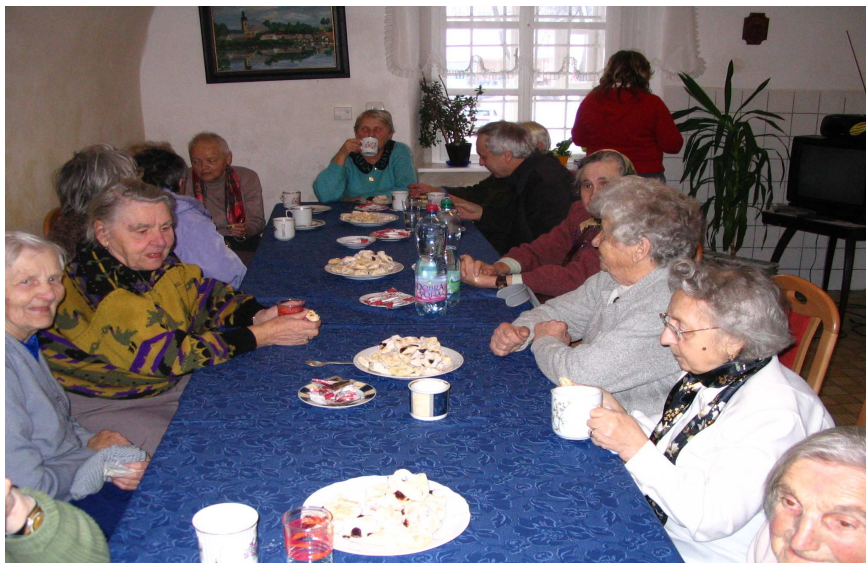
Posezení po Hašlerových písničkách.