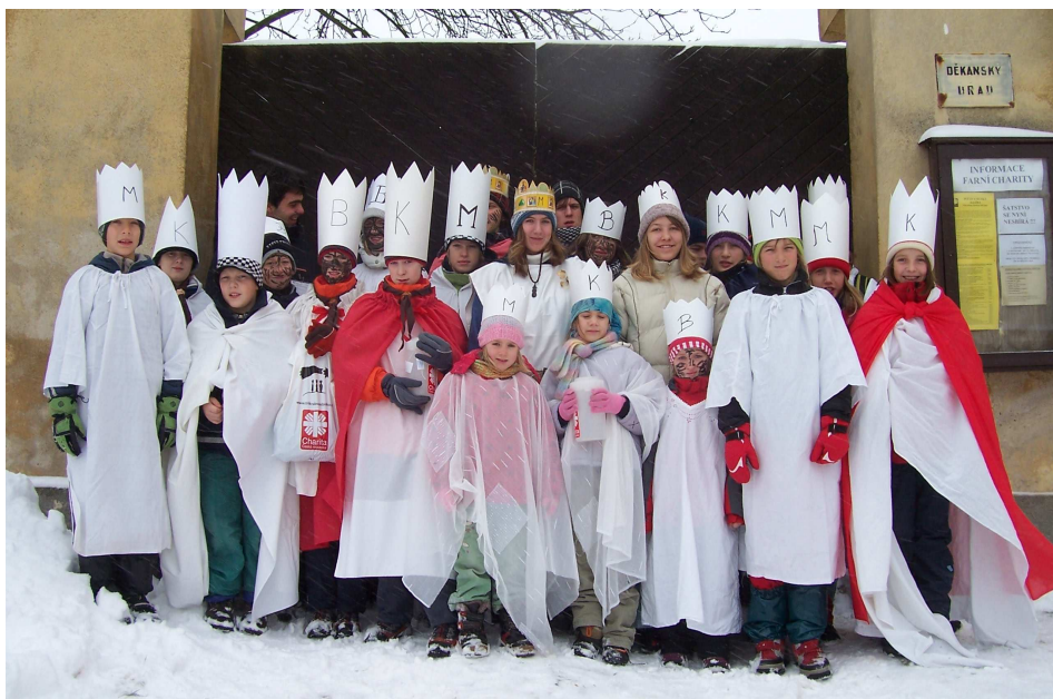
Tříkráloví koledníci 2010